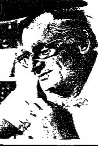
رئيس بلدية حيفا ورئيس تحرير الصحف غورثيل

حيفا - عتم - استقامت بلدية حيفا رؤساء تحرير الصحف في اسرائيل حيث امتعت لهم جولة في المدينة للاطلاع على المشاريع التطويرية والتصريفية فيها